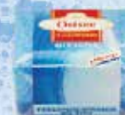
Art.-Nr. 490 716 > Ostsee <