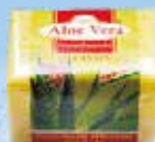
Art.-Nr. 490 812 > Aloe Vera <