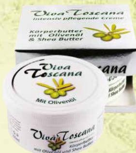
Art.-Nr. 491 055 Viva Toscana Körperbutter mit Oliven-Öl und Shea Butter 300 ml

Olivenöl der Extraklasse, kultiviert und hergestellt an der "Strada del Olio", ist Inhalt dieser Pflegeserie aus reinem Olivenbaumblattkonzentrat. Sie fühlen die Pflege sofort, denn Viva Toscana entspannt und glättet die Haut. Diese Produkte wirken zweifach gegen die Ursachen der Hautalterung, damit die ersten Zeichen der Zeit keine Chance haben. Unser Programm hat eine intensive antioxidative Wirkung: ein natürlicher Schutz vor Freien Radikalen und UV-bedingten Zellschäden wird gewährt.