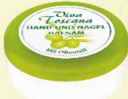
Art.-Nr. 490 355 Viva Toscana Hand und Nagel Balsam 200 ml