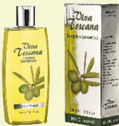
Art.-Nr. 490 287 Viva Toscana Premium Shampoo 250 ml