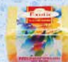
Art.-Nr. 490 717 > Exotic <