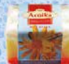
Art.-Nr. 490 768 > Arnika <