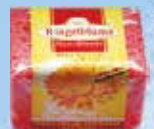
Art.-Nr. 490 744 > Ringelblume <