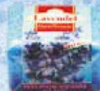
Art.-Nr. 490 829 > Lavendel <