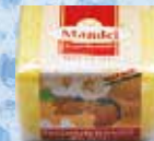
Art.-Nr. 490 799 > Mandel <