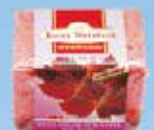
Art.-Nr. 490 775 > Rotes Weinlaub <