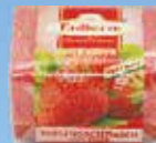
Art.-Nr. 490 714 > Erdbeere <