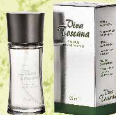
Art.-Nr. 490 324 Viva Toscana Premium Eau de Parfum 50 ml