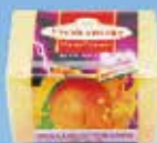
Art.-Nr. 490 712 > Fresh Energy <