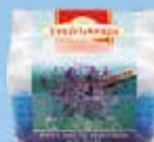
Art.-Nr. 490 751 > Teufelskralle <