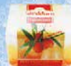
Art.-Nr. 490 447 > Sanddorn <