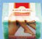
Art.-Nr. 490 805 > Anti-Cellulite <