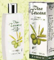
Art.-Nr. 490 294 Viva Toscana Premium Hand & Body Lotion 250 ml