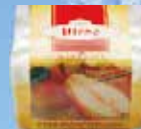
Art.-Nr. 490 715 > Birne <