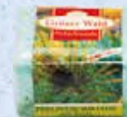
Art.-Nr. 490 718 > Grüner Wald <