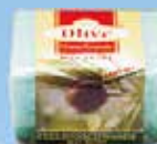
Art.-Nr. 490 454 > Olive <