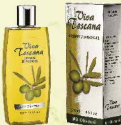
Art.-Nr. 490 300 Viva Toscana Premium Duschgel 250 ml