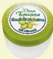
Art.-Nr. 490 362 Viva Toscana Gesichtscreme 50 ml