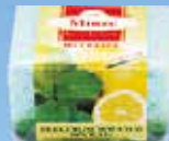
Art.-Nr. 490 711 > Minze <