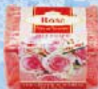
Art.-Nr. 490 782 > Rose <